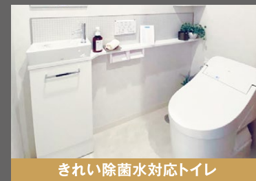
きれい除菌水対応トイレ