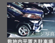
敷地内平置き駐車場