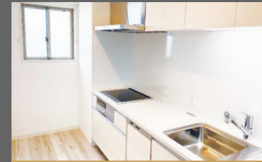
上部棚、換気窓付キッチン