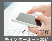
光インターネット常時接続サービス