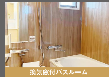
換気窓付バスルーム