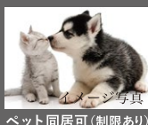
ペット同居可(制限あり)