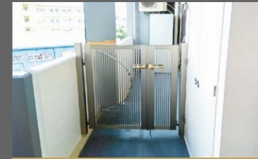
戸建感覚の玄関ポーチ