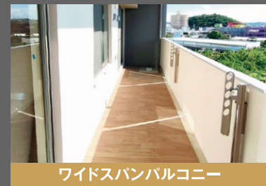
ワイドスパンバルコニー